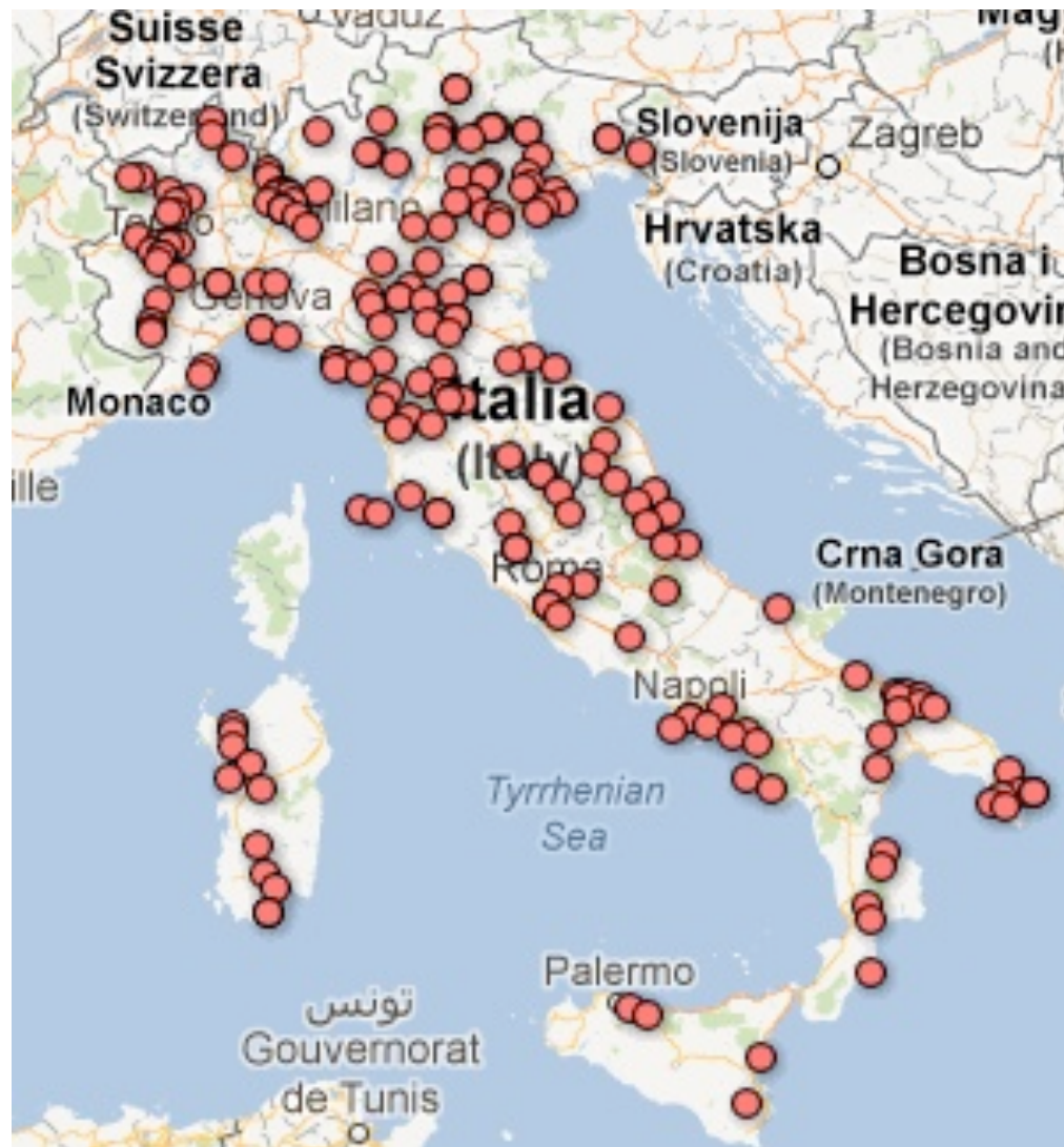
#TwitterPA: mappa antenne T1/2012 [online presso: http://goo.gl/qMVaX ]